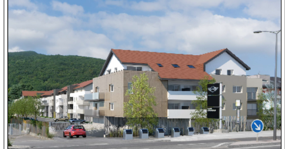
SCCV VETRAZ MONTHOUX RESIDENCE VERTIGE

route de Bonneville 74100 VETRAZ-MONTHOUX